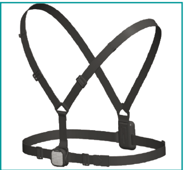
ULTRA CHEST LIGHT USB ADJUSTABLE BRUSTLEUCHE (GRLUC)

Diese Brustleuchte mit 250 Lumen ist die geniale Alternative zur Stirnlampe. Vorne ein starker Scheinwerfer, hinten ein rot leuchtendes Warndreieck. Für Läufer, Radfahrer, Reiter, Elektroroller, Schüler, Inline-Skater, etc. - USB Ladefunktion - nachhaltig und sparsam. - Komfortabel zu tragen. - Wasserfest. Leuchtwinkel einstellbar. - Bis zu 20 m Sichtweite in der Nacht. - Einfache Bedienung per Knopf am Frontlicht. - Fixierung durch einen Schulter- und den Brustgurt. Das Verbindungskabel läuft parallel zum Schultergurt. - Schultergurt und Brustgurte sind verstellbar. - 3 Leuchtmodi. Bis zu 5 Stunden Leuchtdauer. - Gewicht 160 g. - UVP 39,99 €