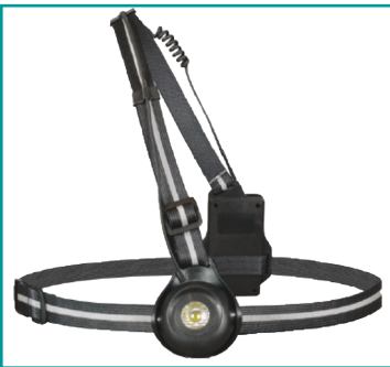
ADJUSTABLE LED CHEST LIGHT USB BRUSTLEUCHE (GRLCA)

Diese ultraleichte LED Stirnlampe ist ein wasserdichter Scheinwerfer mit 160 Lumen und bietet drei Leuchteinstellmöglichkeiten. Der USB-Akku sorgt für bis zu 15 Stunden Leuchtdauer. Die innovative Kopfleuchte lässt sich mittels Bewegungssensor bedienen. Mit einem "Handwisch" können Sie die Lampe ein- und ausschalten, so dass Sie Ihren Laufpartner nicht unabsichtlich blenden. Die Stirnleuchte ist wasserfest und kann auf jede gewünschte Größe eingestellt werden. Gewicht nur 60 g. UVP 32,49 €.