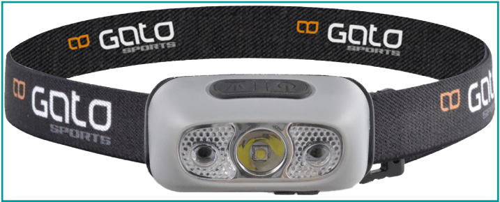
HEAD TORCH LIGHT USB STIRNLAMPE (GRLHT)

Eine starke Leuchtkraft und innovative Details charakterisieren die praktischen „Nachtsichtgeräte“ von Gato Sports - denn es ist immer gut zu wissen, wohin man läuft!