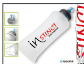
HYDRA CELL 600 ml (ISACCHC3) Soft Flask BPA-frei. UVP 18,50 €

Das größere Trail Pack besitzt alle Vorzüge der oben beschriebenen Vest, bietet aber bis zu 12 L Volumen, 13 Taschen und einen großen wasserdichten Stauraum auf der Rückseite. Verfügbar sind 2 Varianten: ISBAGN UVP 150,- € und ISBAGEKHP mit 2 x 600 ml Softflasks. UVP 175,- €