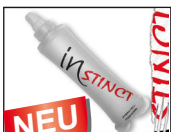
HYDRA CELL 326 ml (ISACCHC1) Soft Flask BPA-frei. UVP 12,- €