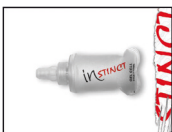
GEL CELL 150 ml (ISACCGC) Soft Flask BPA-frei. UVP 14,- €