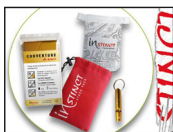
STASH PACK (ISACCSP) Trailrunning Rettungspaket. UVP 12,50 €