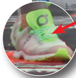
Frederik van Lierde Sieger Hawaii Ironman Championship 2013