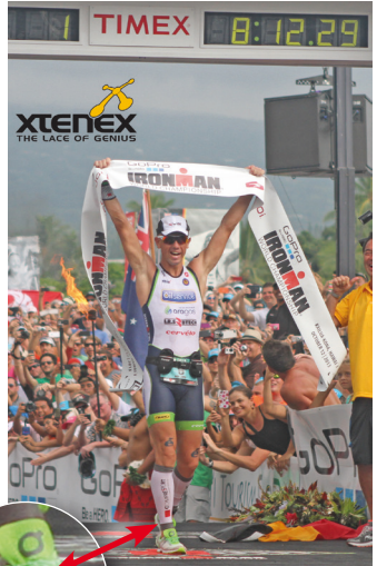
Frederik van Lierde Sieger Hawaii Ironman Championship 2013